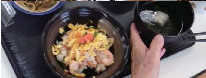
▲(写真上)音楽に合わせてダンス♪ (写真下)ちらし寿司でお祝い