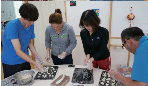
▲団子の生地を練って丸くして美味しくいただきました♪