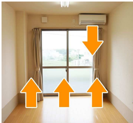
▲エアコン、床暖房のイメージ

単な介護業務の体験をしたのですが、その時に、人の役に立てるこの仕事を将来自分の職業にしたいなあ、と思ったのがきっかけでした。子ども頃から、自分の祖父母とお話をしたり一緒に過ごすことがとても楽しかったというのもあり介護と