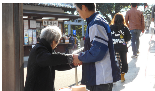
▲おみくじひいていこうかな? 今年最初の運だめし!

ゆつくりとお参りするこ とができました。お賽銭 を投げて、今年一年の健 康や幸運をお祈りしま す。 境内には大分トリニ タのニータンのモデルと なった御神亀があり、な