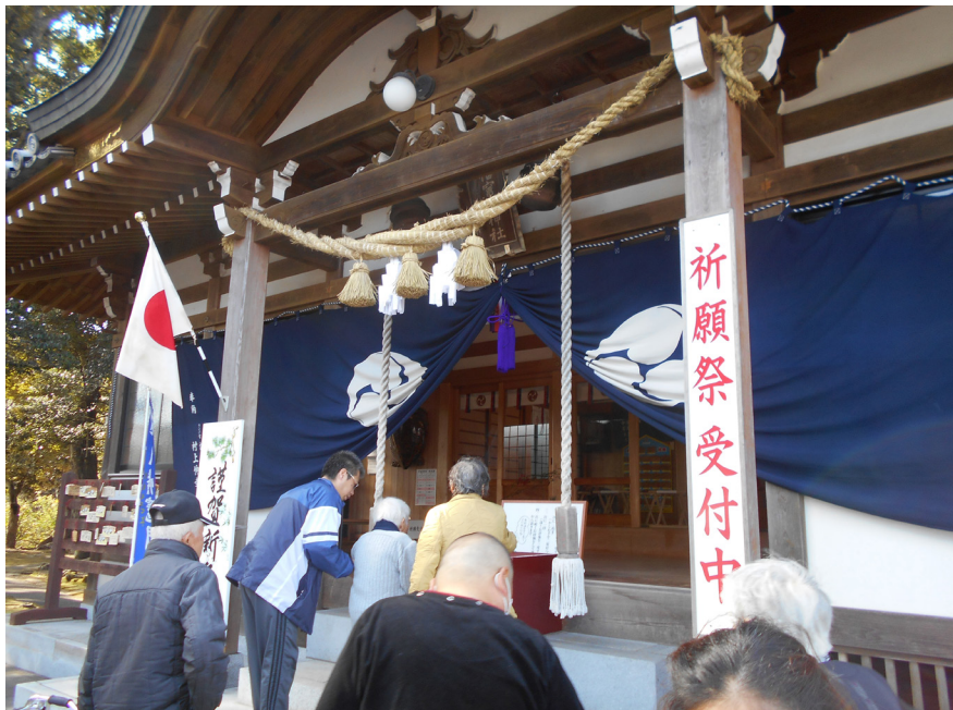
▲今年も良いことありますように。心を込めて、スタッフも一緒に参拝しました。

1月初旬に昨年も訪れた 八幡竈門神社に初詣に行 きました。 当日は、体調の確認を して希望するご利用者様 と出かけることになりま した。 車や一緒に出かけるス タッフの関係で2班に分 かれ、5名ずつでのおで かけです。 八幡竈門神社までは車 で15分。スロープなどが あり、車いすの人でもお 参りしやすい、33神を祀 り、全国的にも稀な多祭 神を祀る神社です。 この日は暖かく、お 天気もよかったですので