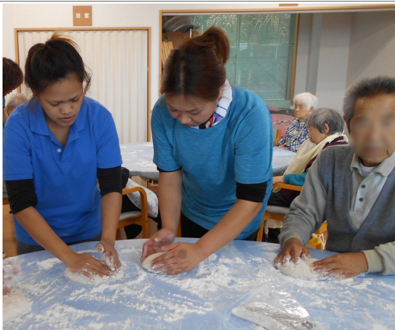
▲あつあつのお餅を手際よくまとめていきます。スタッフも一緒に頑張りました！