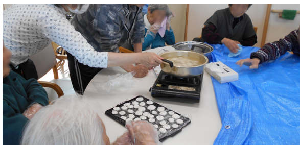
▲つつやつやホカホカ！美味しそうな白玉が茹で上がりました！

テーブルにブルーシートを敷いて、かなづちで鏡餅を割っていきます。ご利用者様に順番に叩いて頂き、『なかなか割れんなあ』と言いながら叩き続ける方もいらっしゃいました。一回りするところにはある程度の小さくなっていきますが、少し大きめなものなどは男性ご利用者様が手でねじりながら、小さくしてくださいました。