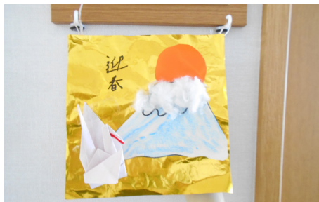
▲勢いのある迎春の文字、新年を祝う準備は万端!