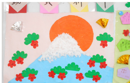
▲色とりどりの色紙に謹賀新年の文字が鮮やか

制作過程を見ていたとこ ろ、健康を願う絵馬を書い ていらつしやる方が多い ようでした。 今は、来月、2月分の壁 飾りを制作中です。 2月は節分や、梅の時期 ということで、季節が感じ られるものを制作していま す。