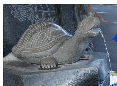
▲八幡竈門神社のアイドル(?)御神亀さま。

でると運が開けるとい ことで、お賽銭を置いて なでる方もいらつしや いました。 帰りにはおみくじを引 いてみると大吉を引いた 方がおり、『今年もい いことがありそうな気がす るなあ』とつぶやかれて いました。