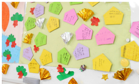
▲思い思いの絵馬が飾られています。