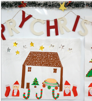
▲見ているだけで楽しくなりますね♪