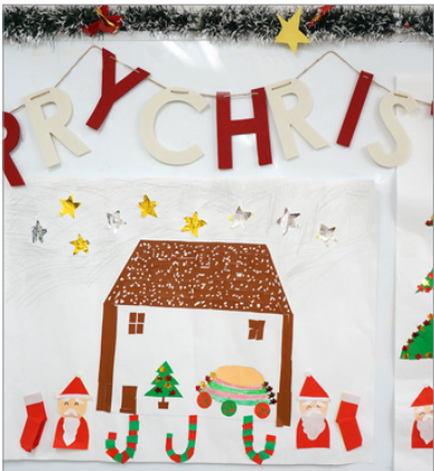
▲見ているだけで楽しくなりますね♪