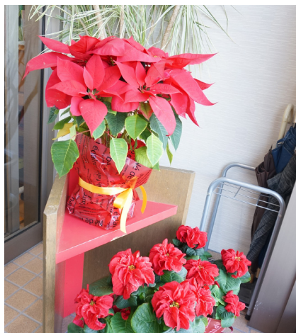
▲「オレンジスパイス」(上) 赤色が綺麗です。

先月の便りでもご紹介した玄関の花ですが、今月はクリスマススイートのイメージもある、ポインセチアが仲間入りしています。ポインセチアは、『赤』『緑』『白』のクリスマスカラーを連想させる色や、花言葉も『聖夜』や、『純潔』などクリスマスにぴったりのこともあって、この