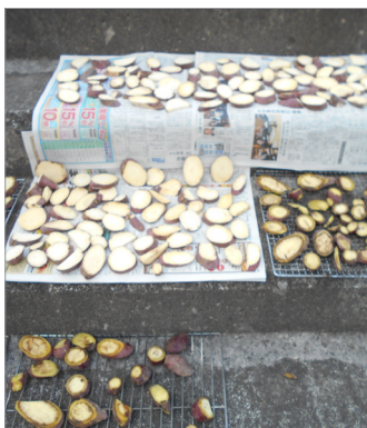
▲干し芋を天日に干している様子。

スイートポテトは、蒸したサツマイモをつぶして、牛乳やバターなどと混ぜて作ります。きれいな小判型に整えて、艶出しの卵黄を塗ってオーブントースターで焼きました。焼けていくにしたがっておいしそうな匂いがフロアーに充満していました。できたてのスイートポテトはほんのりバターの香りがして、とてもおいしかったです。