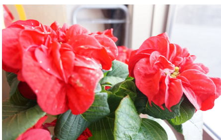
▲外側に葉が巻いていく品種「ウィンターローズ」

その他、毎年恒例となりました焼き芋や、初挑戦の干し芋作りなども行い、サツマイモを堪能した今月のおやつ作りでした。干し芋は、固くできてしまい失敗してしまいましたが、来年は上手にできるように工夫してみたいと思います。