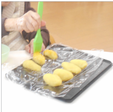
▲つやが出るように卵黄を塗っています。

今月のおやつ作りは、先月に掘ったサツマイモを使ってスイートポテトや芋餡の炭酸まんじゅう、おやきなど多様なメニューをみんなで作りました。