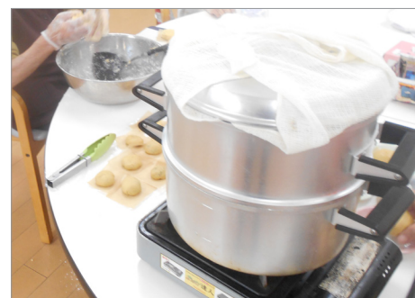
▲丁寧に餡を包んで、大きな蒸し器で蒸し上げます。