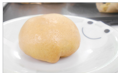
▲蒸かしたての炭酸まんじゅう♪おいしそうです!

一番好評だったのが、芋餡の炭酸まんじゅうです。ご利用者様も昔よく作っていたとのこと、手際よく作業をすすめていました。芋餡をたくさん作りすぎて、あわてて生地を追加で作るといった一幕もありましたが、あつという間に蒸かすところま