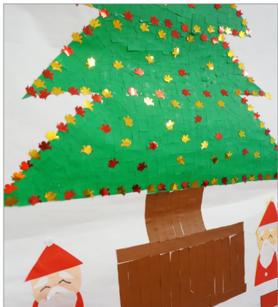
▲よく見ると小さな天使が並んでいます。

り、昼食後の休憩あとの作業としては、とても眠気を誘うものだったらしく、途中とうとうとされるご利用者様もいらつしやいました。しかし、なんとか、協力して完成させることができました。