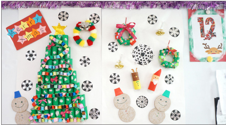
▲トイレットペーパーの芯がツリーに大変身!!

もうひとつの壁画は、ツリーの形をした色紙の淵に、天使の小さな飾りを貼っていきます。これは、とても根気のいる作業とな