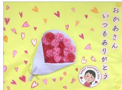
▲舞うハートに喜びがあふれています♡

く桜の花とその間の川を泳ぐ鯉のぼりをテーマに、折紙で折った色とりどりの鯉を貼りこんでいきます。これは、別府の境川で毎年飾られる鯉のぼりをイメージしました。また、雰囲気味わってもらうため、大きな本物の鯉のぼりをディスプレイスフロアに飾りました。