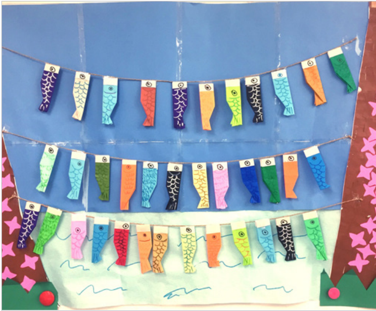
▲ひとつひとつウロコや目の表情が違って、ずっと見ても飽きません。