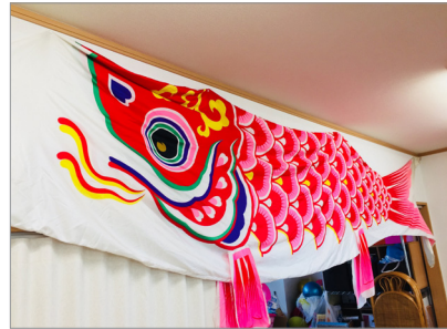
▲今年も登場♪天井に展示された鯉のぼり。

く桜の花とその間の川を泳ぐ鯉のぼりをテーマに、折紙で折った色とりどりの鯉を貼りこんでいきます。これは、別府の境川で毎年飾られる鯉のぼりをイメージしました。また、雰囲気味わってもらうため、大きな本物の鯉のぼりをディスプレイスフロアに飾りました。