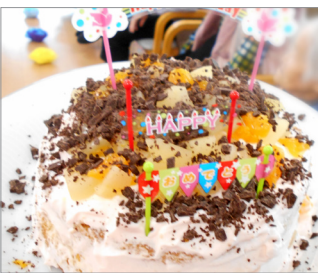
▲スポンジの間にもフルーツが♪♪ボリューム満点のケーキになりました。