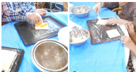
▲今回もおやつ作りで頑張ってくださいました。

た反応とは違っていました。今回のお茶会は、以前入居されていた方の娘さんからご提案をいただき、実現の運びとなったものです。当日はご友人の方と一緒に3名で来ていただきました。ありがとうございました。 ありがたいお申し出にとても感謝しています。ご利用者様からも、またお茶会を開催してほしいという声が聞かれました。機会があれば、ぜひまたこのような時間をもちたいと思います。