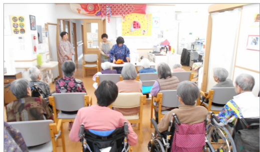
▲ボランティアの皆さん、有難うございました！

まずは、お茶を立てている様子を皆さんで見たり、水ようかんと一緒にたてていただいたお茶をいただきました。ご利用者様の年代は、若いころにお茶を習っていた方が多いようで、お茶をたててもらっている間に昔を懐かしみ、涙する方もいらっしゃいました。スタッフが思っていた