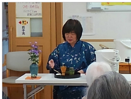
▲ひとりひとりにお茶をたててくださいます。