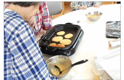
▲「焼けてきたよ!」いい匂いが漂います♡

どら焼きを作りました。まず、小麦粉や卵を混ぜて生地を作り、ホットプレートで焼きます。生地作りは混ぜ合わせるだけの定番の作業なので、ご利用者様も慣れたものですが、今回は手のひらサイズに生地を焼くのが意外と大変でした。