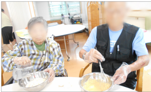
▲手慣れた様子で生地を作っていきます。

どら焼きを作りました。まず、小麦粉や卵を混ぜて生地を作り、ホットプレートで焼きます。生地作りは混ぜ合わせるだけの定番の作業なので、ご利用者様も慣れたものですが、今回は手のひらサイズに生地を焼くのが意外と大変でした。