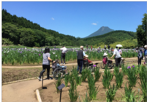
▲また来年も花を見に来ましようね。