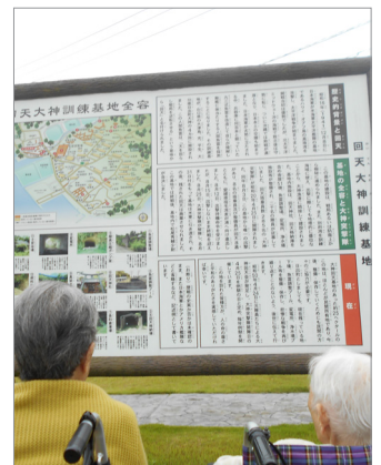
▲1073名もの戦没者が祀られています。

5月の終わりごろ、日出町大神にある「回天記念公園」に出かけました。ここは、戦争時、人間魚雷「回天」の訓練基地で、広い土地に神社や、格納庫や魚雷調整場などが整備されていたそうです。