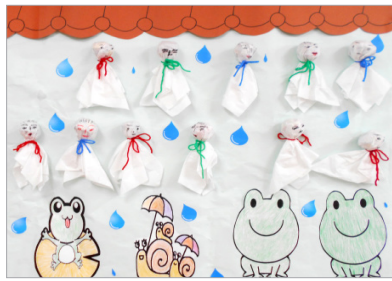
▲さまざまな表情の沢山のテルテル坊主たち。