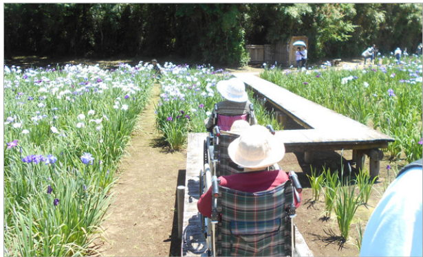
▲山からの爽やかな風をうけながら、のんびりと菖蒲の花を楽しみます。