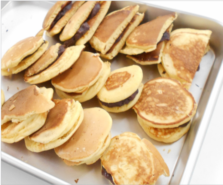
▲ちょっと形は不ぞろいだけど味は抜群！