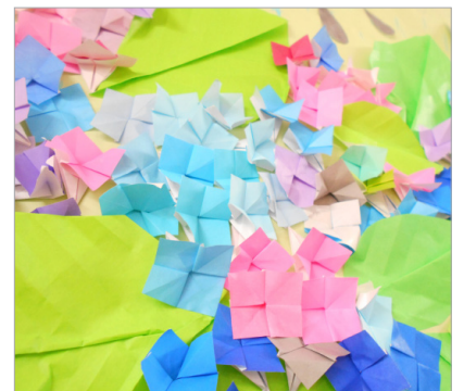
▲淡い色味の取り合わせがとても綺麗です♪