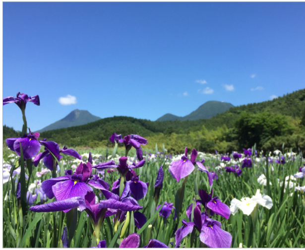
▲鶴見岳と由布岳を眺めやることができる見事な眺望♪