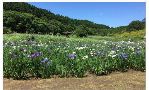
▲鮮やかな緑の合間に、花菖蒲の紫や白の帯が踊ります。