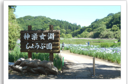
▲お天気にも恵まれて、絶好のドライブ日和に♪

6月の中旬に、別府市鶴見岳のそばにある神楽女湖にドライブにでかけ、恒例の菖蒲鑑賞をしました。予定していた日は、お