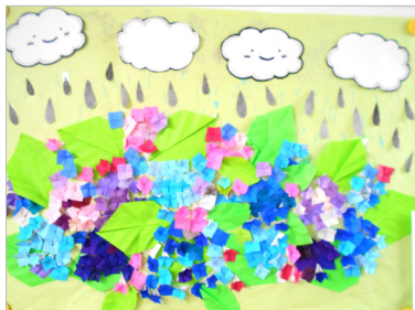
▲葉は折れ目をつけて立体感を出しました。

出来上がったどら焼きは、市販のものとは変わらなくらい美味しく、ご利用者様も嬉しそうでした。