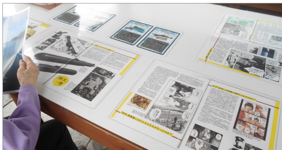
▲大神訓練基地は昭和20年に設置されました。