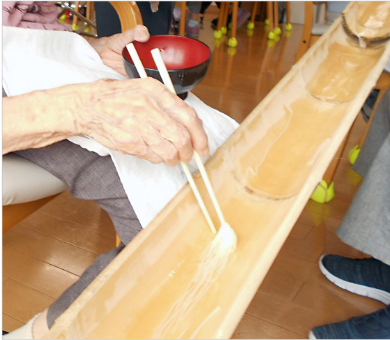
▲スタッフお手製の竹台を、冷たい水と共にそうめんが流れていきます！