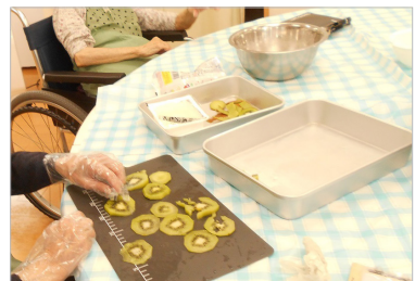
▲型抜きでキウイフルーツを星形にします。

お椀にキラ星☆ 白玉ぜんざい作り 今月のおやつ作りは、七夕にちなんで星型の飾りがついた『白玉ぜんざい』を作りました。 まずは、ぜんざいに入れる団子を作っていきます。団子作りは、ご利用者様も手慣れたもの。手早く豆腐と白玉粉を混ぜて一口大にまとめます。同時に、既に