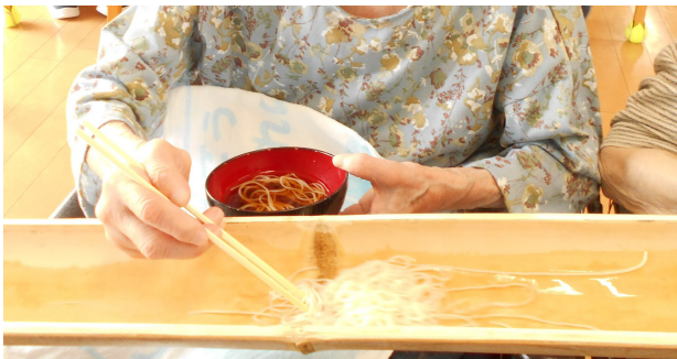
▲見事にキャッチ♪こいつは大漁だ！（ん´∀`）ん♪

いつもなら、たくさん食べないご利用者様も、久しぶりのそうめんを好きになだけ食べられるとあり、割り箸とお椀を抱えて流れてくるのを待ち構えていました。時々、上段の方が取ってしまつて、下の方までなかなかそうめんが流れて来ない場面なども見られました。皆さん楽しんでそうめんが流れてくるのを待ってくださいました。