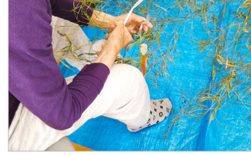
▲笹も届いて、七夕の準備は万端!

を上げたりしたためか、少し疲れた表情の方もいらつしやいましたが、皆さん、完成した笹飾りを見て、とても満足されている様子でした。 当日は残念ながら雨模様でしたが、ご利用者様の願いはきっと天まで届いていることと思います。