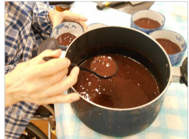
▲ぜんざいのいい香りがしてきました♪

お椀に分けた白玉ぜんざいに、星型のトッピングを飾りつけすれば完成です。 今年は、雨の日が多く七夕もあいにくの雨でしたが、おやつに輝く星で七夕気分が味わっていただけたのではないかと思います。