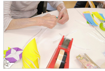
▲季節感のあるお花や夏野菜を作りました。

今年の七夕飾りは、去年とは少し違う趣のものをとということで、三角の色紙や紙鎖以外にも、朝顔や、西瓜、胡瓜などの季節感のある飾り物を制作しました。 7月に入り、笹が届いたのでいよいよ飾りつけに取り掛かります。 屋外に笹を置くため、こよりではなくビニールひもを使用しました。外れないように短冊や飾りに貼り付けたら、笹にくくりつけていきます。最初は、椅子に座って飾りつけを