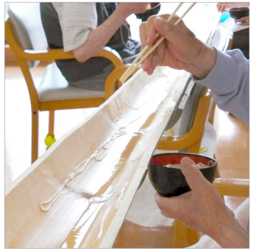
▲冷たくなめらかなのどごしに食も進みます。

いつもなら、たくさん食べないご利用者様も、久しぶりのそうめんを好きになだけ食べられるとあり、割り箸とお椀を抱えて流れてくるのを待ち構えていました。時々、上段の方が取ってしまつて、下の方までなかなかそうめんが流れて来ない場面なども見られました。皆さん楽しんでそうめんが流れてくるのを待ってくださいました。