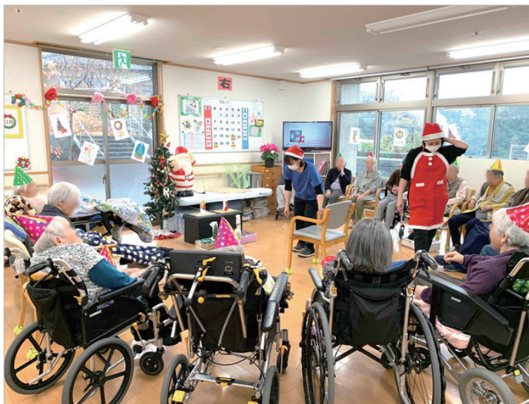
▲とんがり帽子でますますクリスマスモードが盛り上がります♪ (*'ω'*)