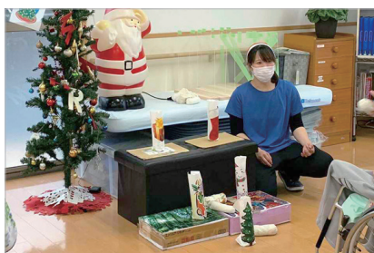
▲的に当たったとき、手を叩いて喜んでいたご利用者様もいらっしゃいました！

いよいよ、クリスマス会のスタート！最初は、ゲームです。クリスマススをイメージした絵柄のついたペットボトルをお手玉を当てて倒していきます。