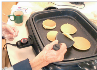
▲こんがりきつね色に焼きました!

今回の柿ジャムはご利用者の皆さんに大変好評で、皆様、あつという間に完食されていました。 ホットケーキミックスを混ぜ合わせ、プレートで焼いていきます。 出来上がったホットケーキを切り分けて、柿ジャムをのせたらおやつ完成です。