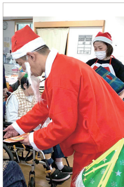
▲サンタさんの登場に会場が湧きます♪