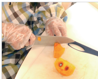
▲柿の下処理はお手のもの♪