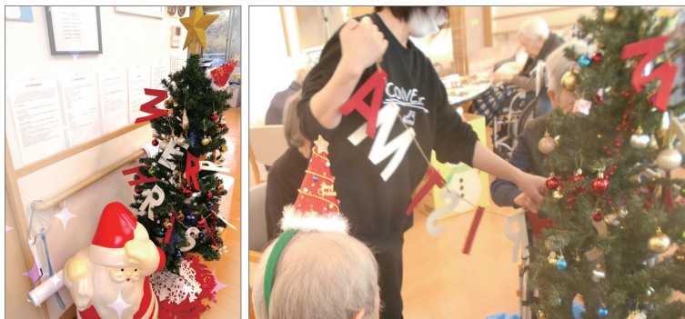
▲ご利用者様と一緒にツリーの飾り付け。壁飾りもクリスマスモードいっぱい！