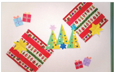
▲廊下もタバストリーとツリーで飾りました♪(^^)